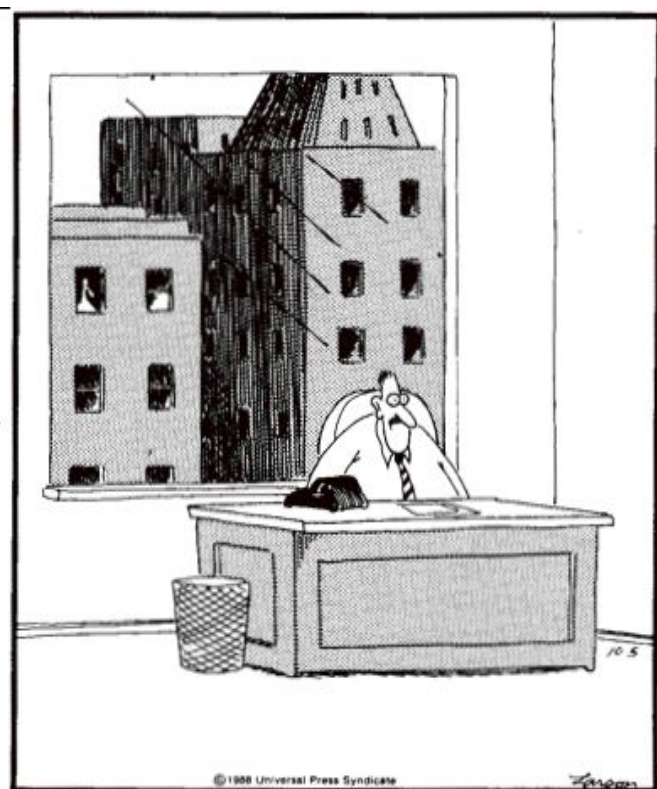
Anatidaephobia: The fear that somewhere, somehow, a duck is watching you.